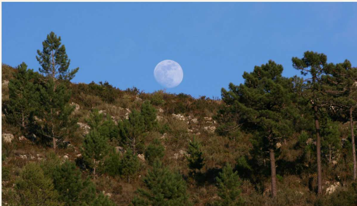
La hora de los murciélagos