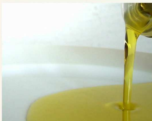
Aceite de oliva