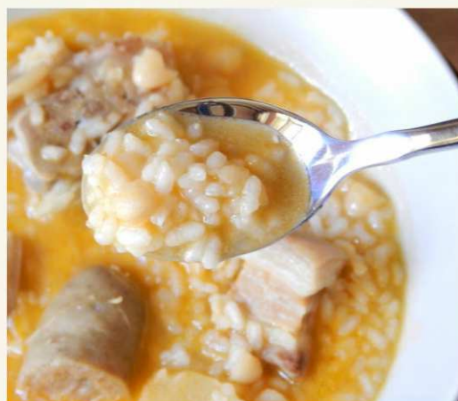
Arroz con alubias y nabo